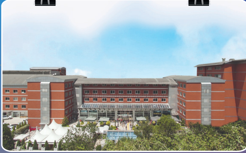
Ayazağa - Maslak Yerleşkesi